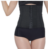
コルセット ¥1,800 税込