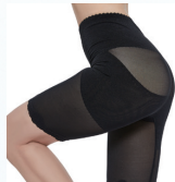
ガードル ¥2,180 税込